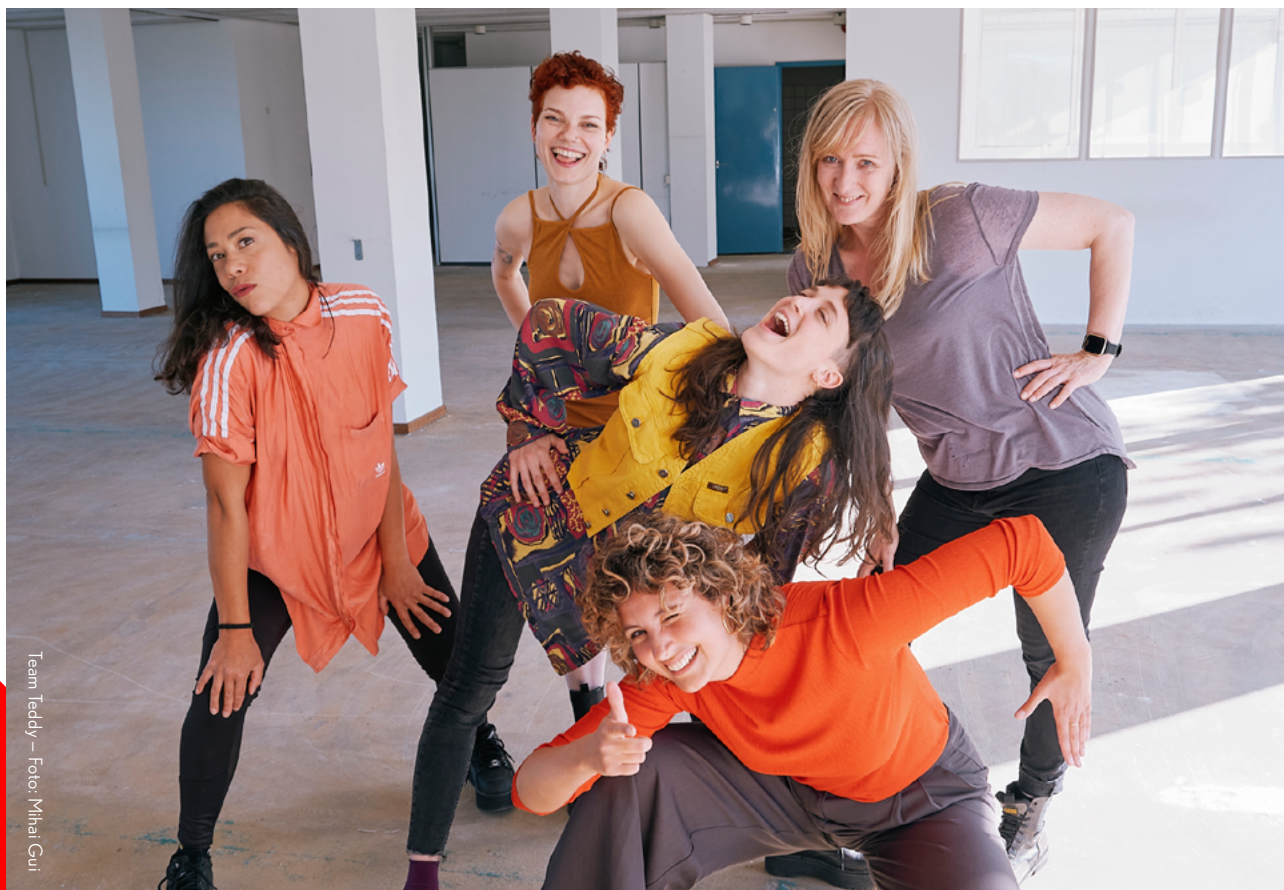
Team Teddy