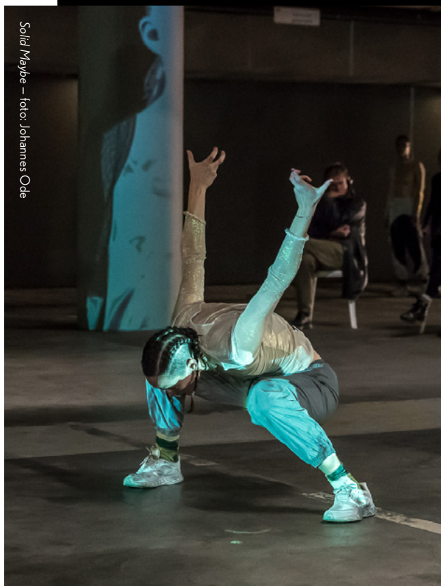
Solid Maybe

Dit is precies wat Teddy beoogt met Body of Goodbyes . Projectsubsidies bieden nog weinig ruimte voor dit soort trajecten. De tweejarige financiële ondersteuning van de Impulsregeling zou dit mogelijk maken.