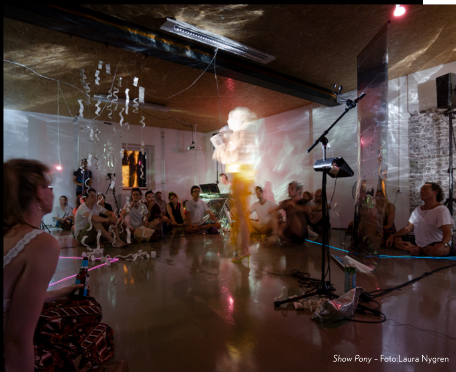
Show Pony

De doelgroepen zullen – naast deze programmeurs en fondsen – Teddy's achterban, het publiek van WORM en O. Festival zijn.