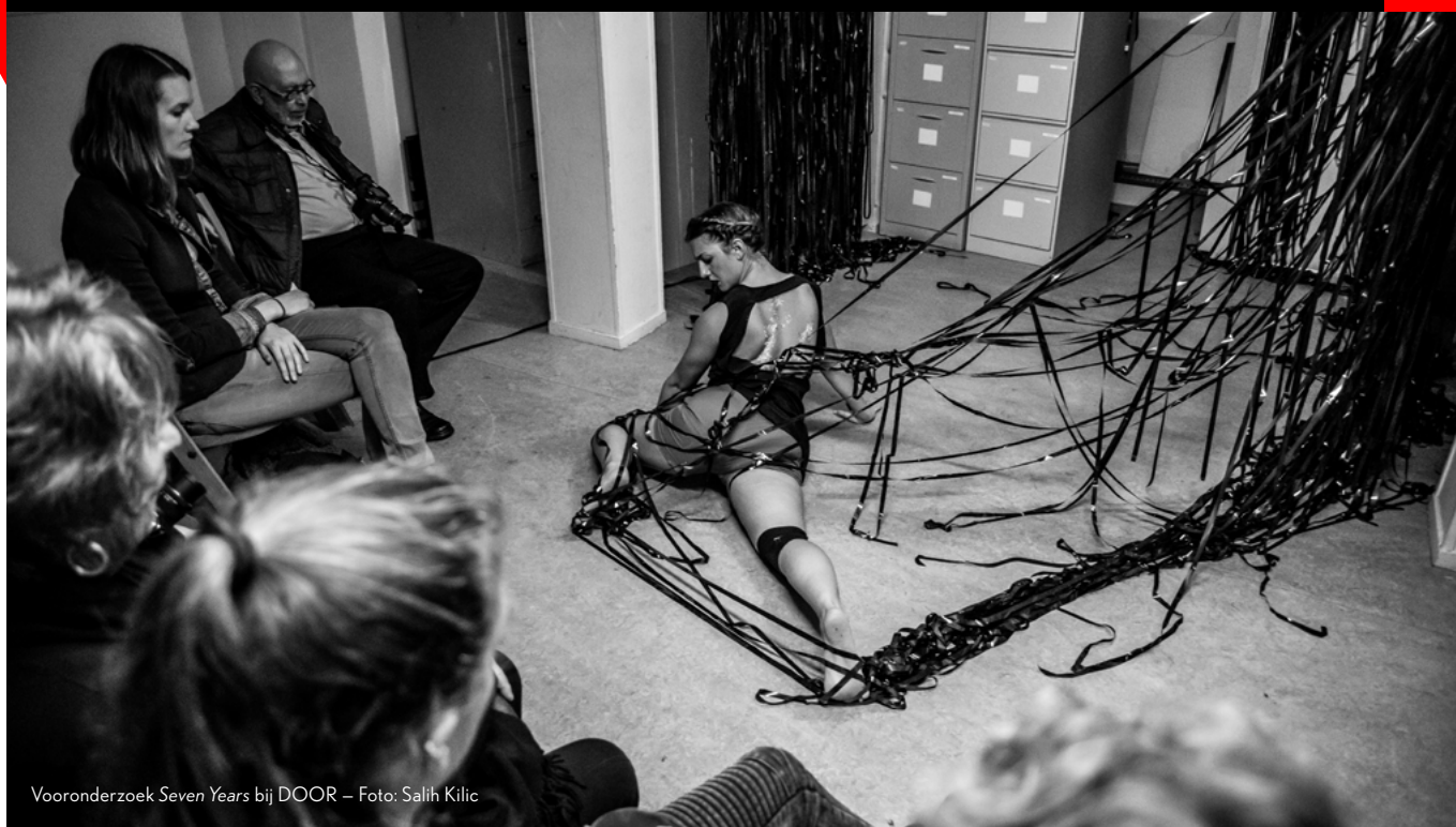
Vooronderzoek Seven Years bij DOOR