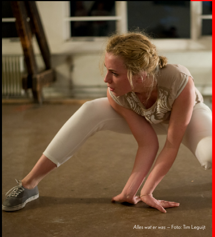
Alles wat er was

Qua inclusiviteit vinden we het belangrijk om meer kansen te creëren voor MBO-studenten in de podiumkunstensector, en een ruimte te bieden waar zij ook hun kwaliteiten als makers kunnen ontwikkelen. Met de ontwikkeling van Teddy's talents zetten we hierin een grote stap. Onze keuze om voorstellingen op locatie te maken is ook deels ingegeven door onze wens om inclusief te zijn. Onze jonge doelgroep ervaart soms nog een drempel om naar het theater te gaan. Door op locaties elders te spelen houden we onze voorstelling ook voor hen toegankelijk. Tot slot hebben wij in de keuze onze nieuwe bestuursleden de inclusiviteit een rol laten spelen. Een afspiegeling te laten zijn van de diversiteit waar Rotterdam zijn bekend staat.