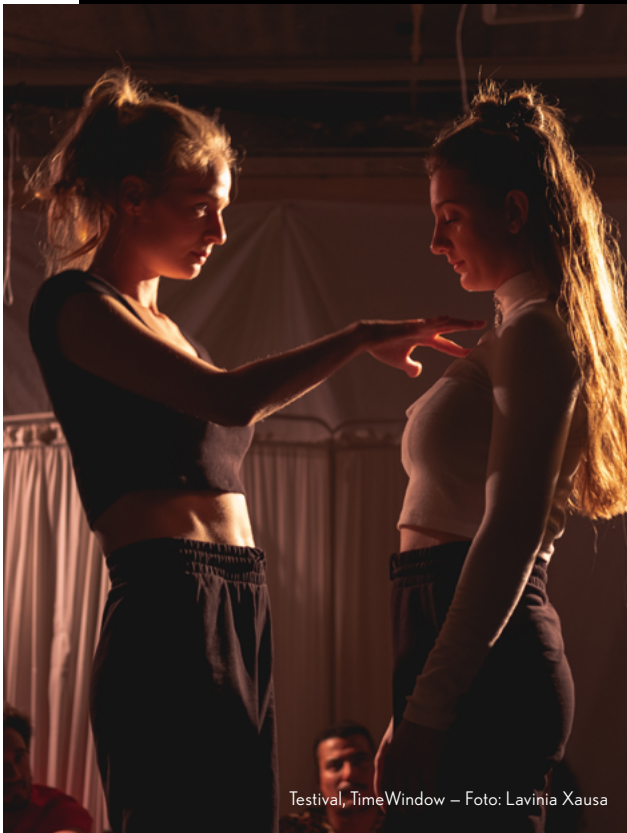
Testival, TimeWindow – Foto: Lavinia Xausa

Culturele Alleseters zijn jonge Rotterdammers met volle agenda's en een rijk sociaal leven. Ze verkrijgen hun informatie digitaal, via social media en influencers. Traditionele mediaplatforms als Volkskrant, Parool en NRC Next leest de Culturele Alleseter ook, maar dan online. Wil je hun aandacht? Dan moet je opvallen! Teddy valt op door ze te verrassen met voorstellingen op spannende locaties.