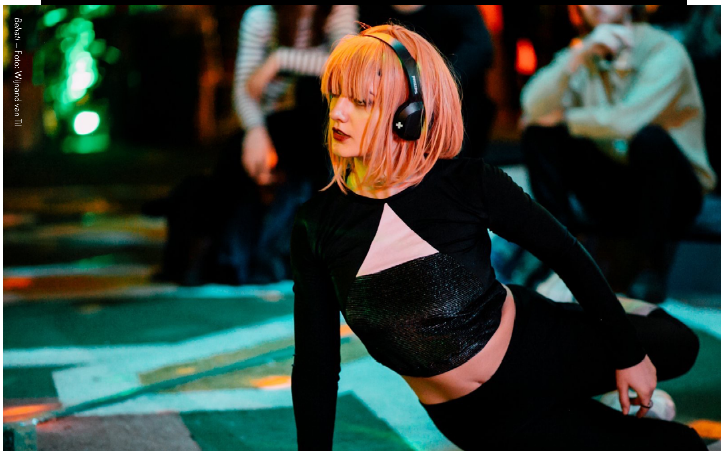
Behart