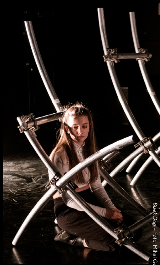
Black Dog – Foto: Mhai Cui

Een bijgevolg van deze manier van leiden is dat moment en vorm van de première en speelreeks afhankelijk zijn van de ontwikkeling van het project. Een voorstelling wordt pas getoond wanneer de makers daar klaar voor zijn. Als het werk nog te pril is, wordt samen met de makers en partners gekeken naar een alternatief tijdsplan. Dit vraagt flexibiliteit van onze partners, daarop zijn ze uitgekozen.