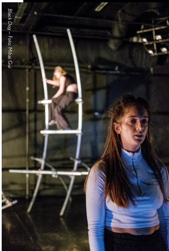
Black Dog

Er zijn enkele kaders waarbinnen gewerkt zal worden. Gezien onze expertise als (interdisciplinair) dansgezelschap moeten de werken een focus op beweging hebben. Qua inhoud en thematiek is het een pré (geen vereiste) als concepten in lijn liggen met Teddy's focus op artistiek onderzoek, en op het tonen van - en empathie creëren voor - de kwetsbare kanten van de hedendaagse Rotterdammer. Stijl en vorm liggen open, evenals hun keuze om werk te maken voor in de theaterzaal of voor op locatie. Het traject is erop gericht om de eigen stem en vorm van de jonge makers te ontwikkelen, dus dat is te allen tijde leidend.