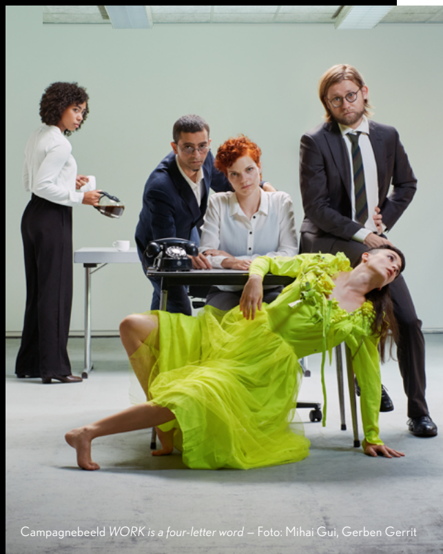
Campagnebeeld WORK is a four-letter word

Onze vorige aanvraag stond in het teken van het concretiseren en ontwikkelen van de drie kernwaarden van Teddy's maakpraktijk: gefaseerd, interconnectief en locatiegericht. Dit hebben we gedaan binnen de context van twee dansvoorstellingen op locatie: de voorstelling Solid Maybe over angststoornissen (speelde in najaar 2021 twintig keer in ondergrondse parkeergarages in Rotterdam en Dordrecht) en WORK over te hoge werkdruk (speelt vanaf oktober 2022 in Rotterdam en Dordrecht). Beide voorstellingen hebben we in meerdere fases ontwikkeld om zo ruimte te creëren voor artistieke verdieping, inhoudelijk onderzoek, nieuwe interdisciplinaire samenwerkingen, en tussentijdse toon- en feedbackmomenten met publiek. Solid Maybe toonde simultaan hoe drie generaties dansers met angst omgingen, en combineerde daarnaast live dans met videoprojectie. Wij hebben het gefaseerde maakproces daar ingezet om al deze verschillende vertellingen goed te kunnen ontwikkelen en vervlechten. WORK combineert dans met o.a. poëzie; hier stelt het gefaseerde maakproces ons in staat deze interdisciplinaire samenwerking volledig te benutten, en de genuanceerde betekenislagen van dit gecompliceerde thema recht aan te doen.