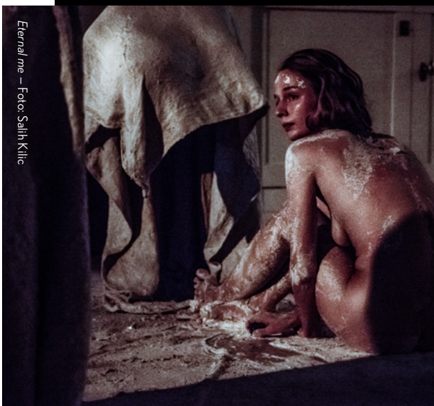
Eternal/ine