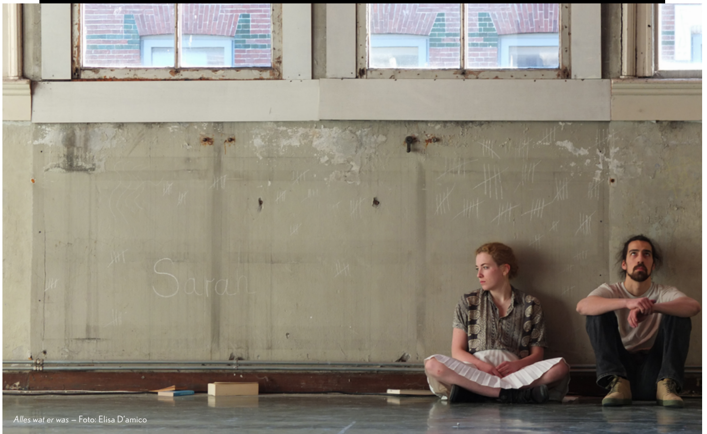
Alles wat er was – Foto: Elisa D'amico

Aan het eind van deze intensieve reeks heeft elke maker niet alleen het inzicht in de eigen artistieke stem(pe)l vergroot, maar ook een stevig plan in handen. Fase 1 wordt afgesloten met een presentatie voor een door Teddy samengesteld team van professionals dat de plannen beoordeelt op artistieke zeggingskracht en productionele/financiële haalbaarheid, en een maker selecteert voor fase 2. Teddy heeft hierin als producent de doorslaggevende stem. Alle deelnemers ontvangen uitgebreide feedback.