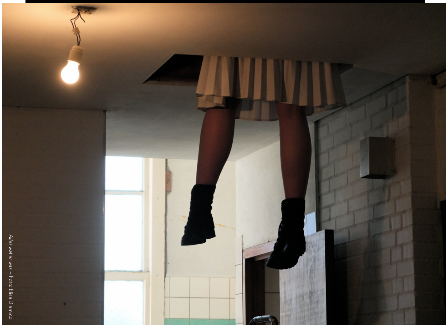
Alles wat er was