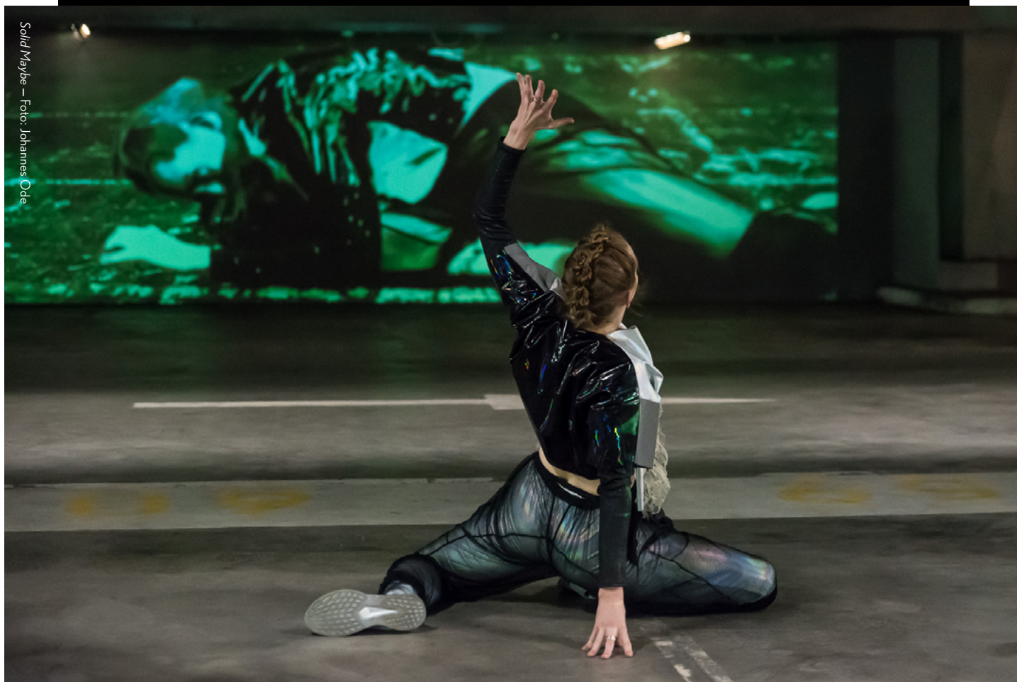
Solid Maybe

De danswereld is een veeleisende wereld, waarin keihard werken, streng zijn voor jezelf en je lichaam tot het uiterste pushen nog te vaak als iets positiefs wordt gezien. Choreografen verwachten vaak bergen van dansers, en dansers nog meer van zichzelf. Deze verwachtingen stuwen elkaar tot grote hoogten – te hoog, als je niet oppast. Langzaam komt hier meer aandacht voor, bijvoorbeeld via het socialmediakanaal Groovydance 3 maar de danswereld heeft nog een lange weg te gaan. Marijke vindt het belangrijk om met Teddy te leiden vanuit compassie en respect voor dansers. Zij wil niet in de voetsporen treden van tal van (veelal oudere) choreografen die de fysieke en mentale grenzen van hun dansers niet altijd voorop zetten. Dit doel wordt nog belangrijker door haar transitie naar een artistiek leider die ook andere jonge makers onder de vleugels neemt. Deze verschuiving creëert meer (fysieke en figuurlijke) afstand tot het maakproces, en een nieuwe machtspositie. Dat maakt het nog belangrijker deze waarden continu centraal te stellen, te blijven bevragen en bespreken. Body of Goodbyes is het laatste project waarin Marijke zelf als danser optreedt (in het volgende hoofdstuk gaan we in op de redenen en beoogde zeggingskracht hiervan). Door – met dit hernieuwde bewustzijn van compassievol leiderschap in gedachten – nog eenmaal aan de uitvoerende kant te staan, kan Marijke haar inzicht aanscherpen in wat dansers in zo'n proces kunnen ervaren en nodig hebben.