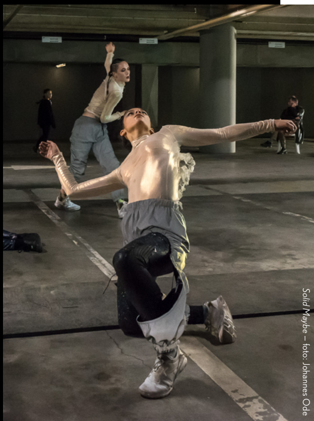
Solid Maybe

Deze aanpak vormt ons grote maakproject van 23/24, het driedelige interdisciplinaire onderzoek Body of Goodbyes . We geven alle drie de hoofdstukken een eigen doel en onderzoeksvraag. Doelgroep, presentatievorm en -plek en bijbehorende marketing spitsen we daarop toe. Zo worden het niet slechts tussentijdse feedbackmomenten, maar drie unieke hoofdstukken die elk een eigen doel dienen. En kunnen we de inhoudelijke voordelen van deze gefaseerde werkwijze nog beter benutten, terwijl we ondertussen werken aan onze doorlopende zichtbaarheid en publieksbinding.